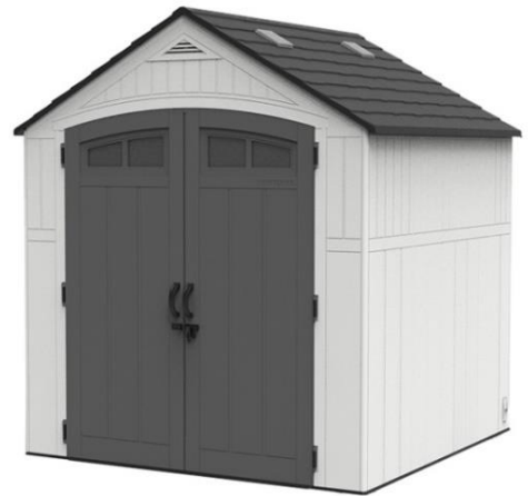
Remise de 1,85 m x 1,85 m = 3,5 m 2 (6' x 6' = 36 pi 2 )